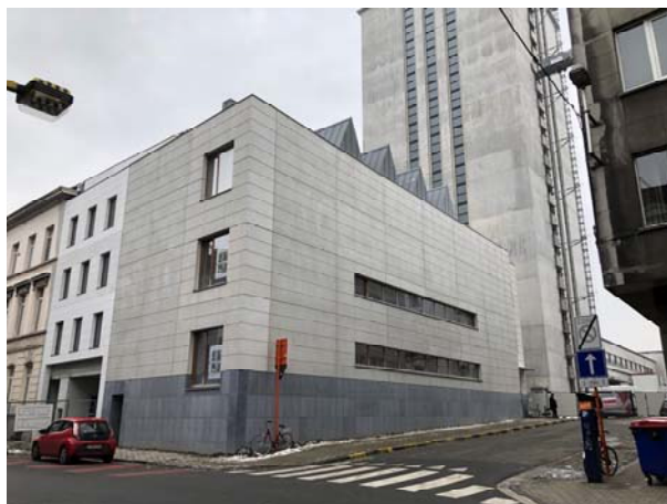
in de schaduw van de Boekentoren