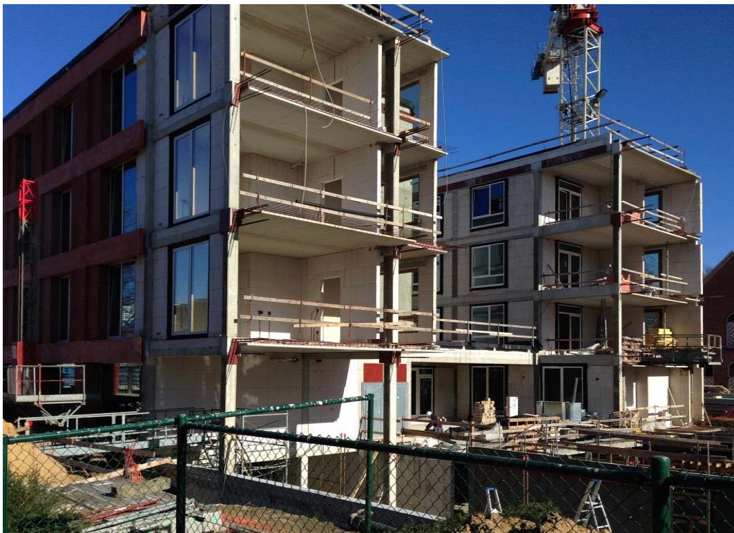
Fase 1 in gebruik, fase 2 in afwerking, fase 3 in ruwbouw ondergrondse parking

Nieuwbouw: Het nieuwe woonzorgcentrum met 180 kamers wordt gebouwd naast het bestaande WZC.