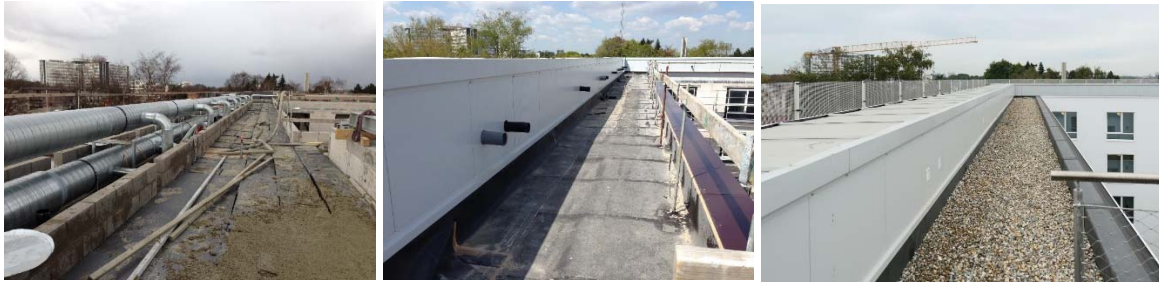
Horizontale kanaalverdeling in dakopbouw