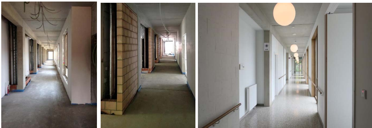
Verticale leidingkokers in de gang