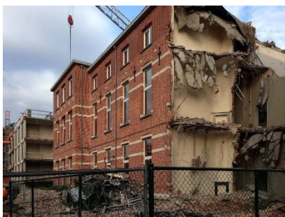
Afbraak en nieuwbouw ontmoeten elkaar

Het bouwdeel 3 staat in het masterplan op de plaats van een af te breken vleugel van het bestaande woonzorgcentrum. In de fasering is opgenomen dat eerst bouwdeel 1 volledig afgewerkt en in gebruik genomen wordt met verhuis van de bewoners van de af te breken vleugel. Pas na de afbraak kan de ruwbouw van fase 3 starten. De fasering is een uitgangspunt voor het concept van de technieken. De stookplaats, energie-invoeren, en centrale keuken zitten in bouwdeel 1.